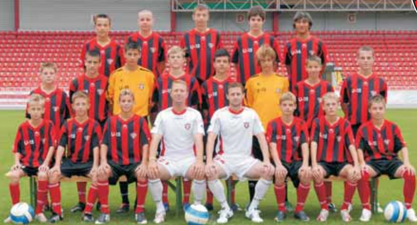
STARŠÍ A ŽIACI FC SPARTAK

MESTO TRNAVA · ŠTADIÓN ANTONA MALATINSKEHO