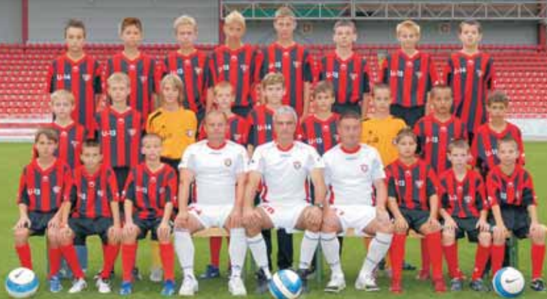
MLADŠÍ A ŽIACI FC SPARTAK